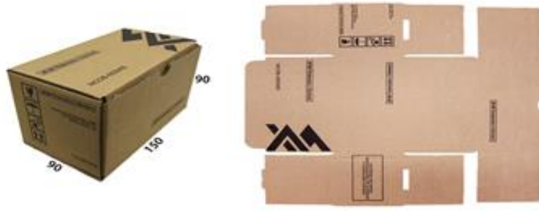
Exemplo de Caixa de Papelão T-20 CX DE PAPELÃO P/MISCELANEA 1(150X90X90 MM)