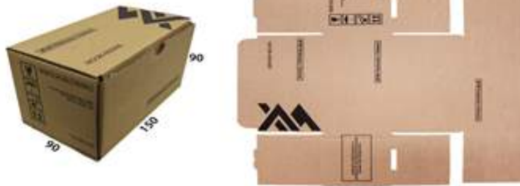
Exemplo de Caixa de Papelão T-20 CX DE PAPELÃO P/MISCELÂNEA 1 (150X90X90 MM)