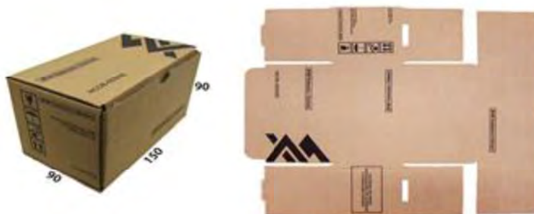
Exemplo de Caixa de Papelão T-20 CX DE PAPELÃO P/MISCELÂNEA 1(150X90X90 MM)