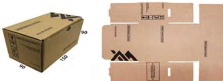
Exemplo de Caixa de Papelão T-20 CX DE PAPELÃO P/MISCELANEA 1(150X90X90 MM)