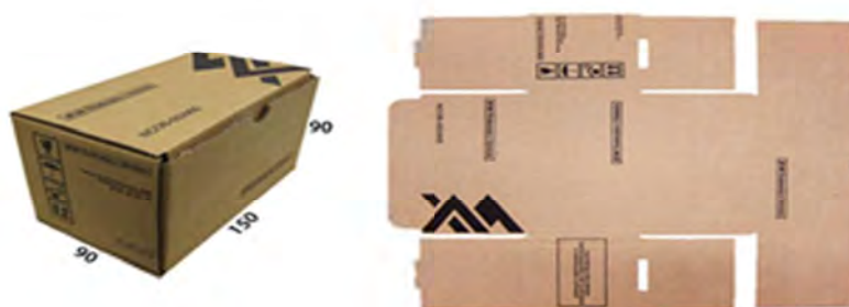
Exemplo de Caixa de Papelão T-20 CX DE PAPELÃO P/MISCELANEA 1(150X90X90 MM)