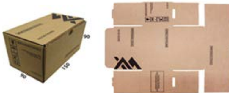
Exemplo de Caixa de Papelão T-20 CX DE PAPELÃO P/MISCELANEA 1(150X90X90 MM)