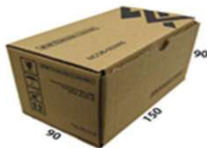
Exemplo de Caixa de Papelão T-20 CX DE PAPELÃO P/MISCELANEA 1 (150X90X90 MM)